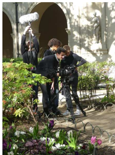
Les étudiants de Ciné créatis