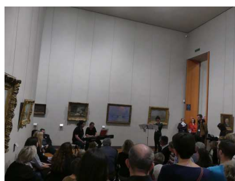
Projet de Quentin Toureau