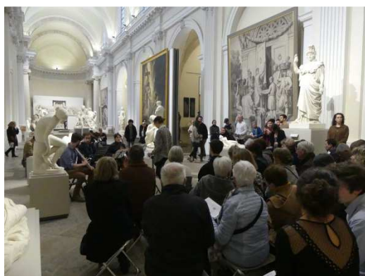
Projet de Céline Houriez

Quelques explications : Le musée des Beaux-Arts a initié un projet original en partenariat avec le Master Musiques Appliquées aux Arts Visuels (MAAAV) de l'Université Lyon 2 : depuis une dizaine d'années, de jeunes compositeurs sont invités à créer une composition musicale en regard sur une oeuvre d'art.