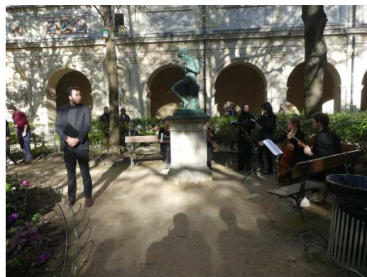
Projet d'Antoine Gasse

Quelques explications : Le musée des Beaux-Arts a initié un projet original en partenariat avec le Master Musiques Appliquées aux Arts Visuels (MAAAV) de l'Université Lyon 2 : depuis une dizaine d'années, de jeunes compositeurs sont invités à créer une composition musicale en regard sur une oeuvre d'art.