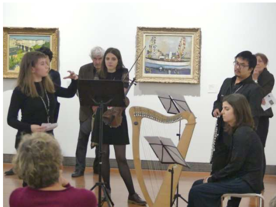
Projet d'Emilia Vercauteren