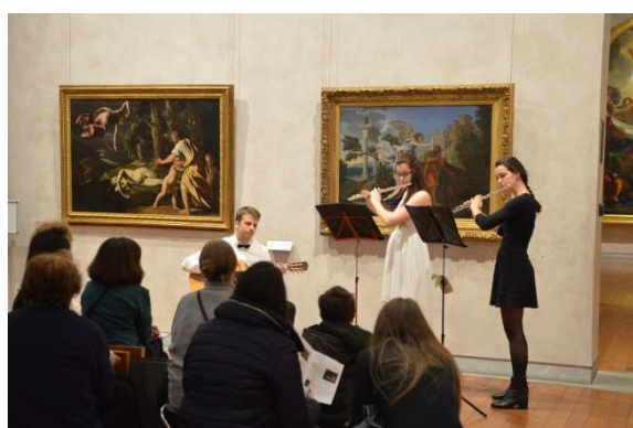
Projet de Dorian Spiess