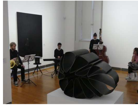
Projet de Guillaume Chapuis